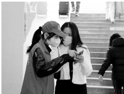
志愿者为旅客解答问题。

本报讯(记者林明聪 通讯员李强 刘媛)春运期间,为应对返程客流高峰,保障旅客的安全,共青团吴川市委员会组织一批寒假“返乡”的大学生志愿者于吴川高铁站开展志愿服务活动,助力春运平安有序进行。