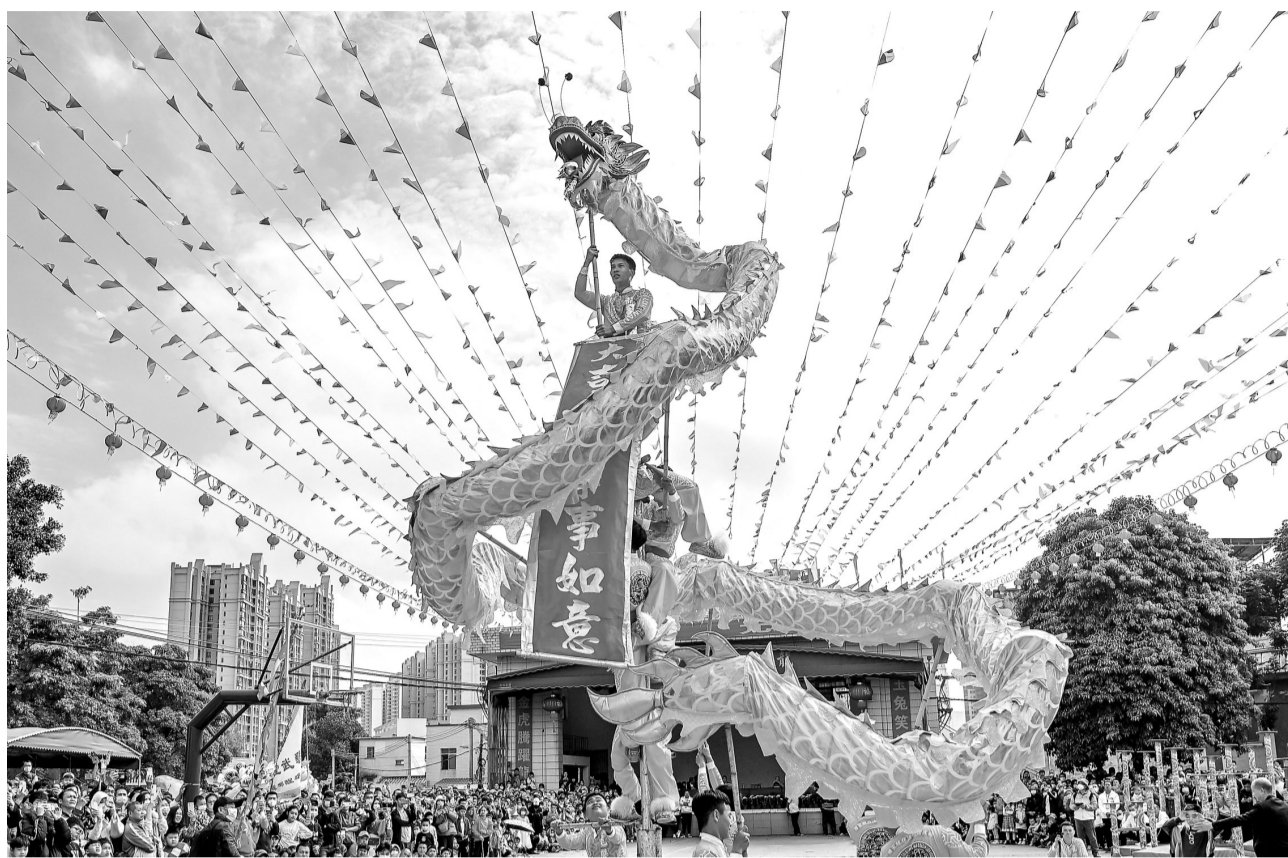
2月2日,湛江经开区龙潮村开展年例巡游活动,热闹非凡。

本报讯(记者杨雅丽)2月2日,农历正月十二,湛江经开区龙潮村的舞龙舞狮队伍穿过大街小巷,通过舞龙舞狮、武艺、仪仗队等丰富多彩的表现,给全村人民带来浓浓的喜庆和欢声笑语。