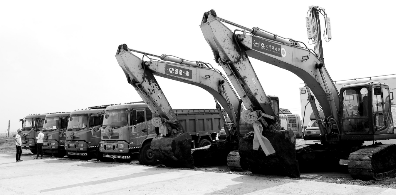
3月3日上午,乌石油田群陆上终端处理厂建设启动会在雷州市乌石临港工业园举行。本报记者 李波 摄

本报讯 (记者林小军 李亚强)3月3日上午,乌石油田群陆上终端处理厂工程建设启动会在雷州市乌石临港工业园举行。 “项目正式开工!”随着一声令下,现场响起大型机械作业的轰鸣声。此次开工,标志着广东省首个近海浅层油田油气上岸项目正式进入建设阶段。深耕北部湾41年的中国海油,将首次把海洋油气从数千米深的海底引上雷州半岛。 乌石油田群位于南海北部湾盆地乌石凹陷的东部,距涠洲油田群约80千米,距雷州市乌石镇约25千米。该区域在20世纪70年代就已有储量规模可观的勘探发现,但由于断层复杂、低孔低渗的地质特征,开发难度大、经济效益差,此前一直未能投入实际开发生产。 “把海洋油气引上岸,是扎根湛江的海油人追逐多年的梦想。”中海油(雷州)有限公司董事、总经理戴毅表示,持续不断的勘探让乌石油田群储量规模不断扩大,开采方案的“精耕细作”进一步降本提效——湛江海油人与中海油研究中心积极创新海上平台类型,优化钻井完井方案,依靠自主创新打破国外技术垄断,让乌石油田群的潜力一点一点地释放出来,开发的经济性越来越明显。同时,湛江市委、市政府全力协调项目开发诸多问题,为推动油气上岸创