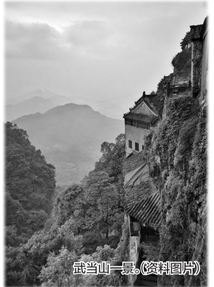
武当山一景。(资料图片)

玄武殿的正殿北侧门外是一处幽静雅致的院落，依岩建有五云楼、皇经堂和藏经阁。五云楼为一支柱子支撑着十二根大梁其间有梁坊十二根柱，下以一根柱子支撑，结构奇特，设计周密，技艺精湛，巧夺天工。站在五云楼前举目欣赏，便让人深感中国古代建筑技术的博大精深，武当山不愧为“我国古代建筑成就的博物馆”。