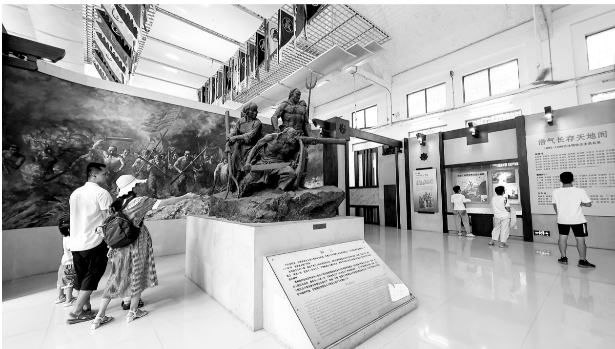
7月25日上午,游客在湛江市博物馆展厅内参观。据了解,暑假期间前来湛江市博物馆参观的人数较以往相比翻了一倍,每天达到600多人。