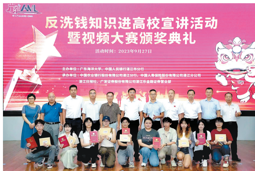
参会嘉宾与获奖学生合影。