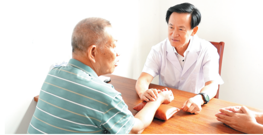
广东省名中医蔡柏为村民把脉。通讯员 陆浩鹏 摄

“年龄大了身体各处都会不舒服,经常要往医院跑,现在名中医直接到家门口看诊,真是太方便了。”村民莫大叔拿着蔡医生开的药方走出来,边看边说。为切实推动中医药文化“进乡村”,普及和中医中药知识,提升农村居民中医药健康文化素养,传承弘扬中医药文化,从9月25日起,坡头区通过邀请广东省名中医蔡柏,湛江市名中医伍明初等名中医进驻龙头镇莫村“咱村铺仔”,每周一、三、五出诊,为老百姓提供贴心的医疗服务,让当地百姓在家门口就享受到优质专业的中医健康服务,满足群众对中医药诊疗和养生保健服务的需求,助力坡头区全面推进乡村振兴和深入实施“百县千镇万村高质量发展工程”。