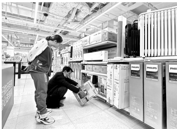
12月18日上午,赤坎区一家商超内,顾客在选购取暖器。由于气温骤降,商超内的棉被、电热毯、取暖器等销量激增。