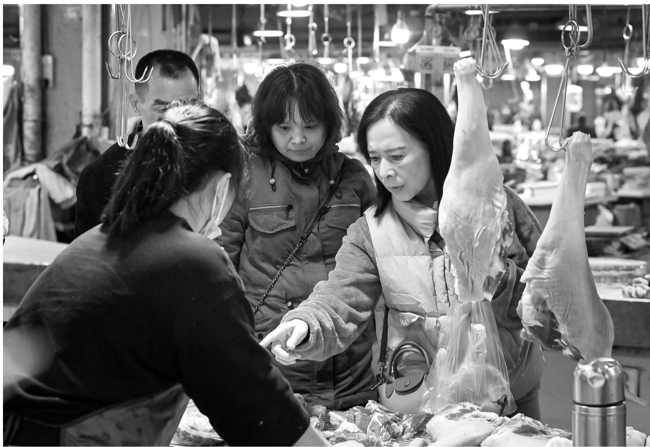
12月18日,市民在赤坎百园市场选购羊肉。本报记者张锋锋 摄