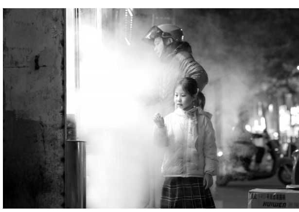
12月18日晚,赤坎百姓路一家包子铺,小女孩在寒风中等待热气腾腾的包子出炉。