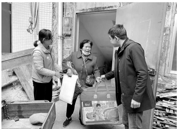
12月18日,市民政局工作人员来到廉江等地,为困难群众送上御寒用品。