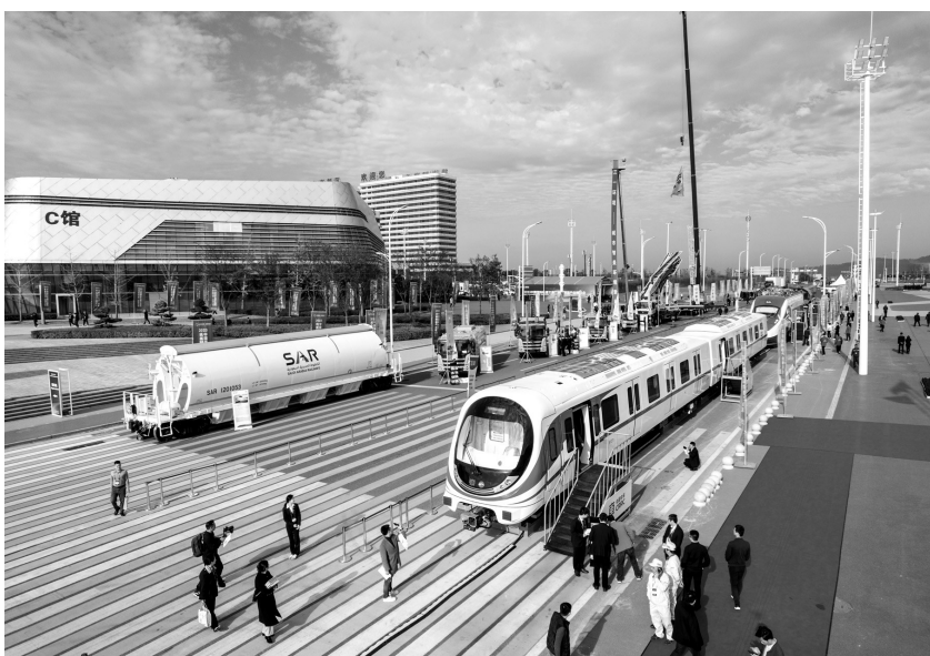
在株洲国际会展中心拍摄的户外展示区。

“这款专为沙特客户定制的磷酸盐漏斗车,最大承载量可达100吨。”项目负责人介绍,不同于平车和铲车,磷酸盐漏斗车具有顶盖和底门漏斗自动开闭功能,可实现全天候无人操作