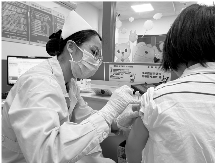
4月13日,一名初一适龄女生接种人乳头瘤病毒(HPV)疫苗。

记者了解到,2023年度我市将“为4.45万名初一适龄女生提供免费的HPV疫苗接种”作为民生实事,2023年9—11月份我市卫生系统共为5.16万名女生提供了免费的HPV疫苗接种,超额完成了民生实事的任务。