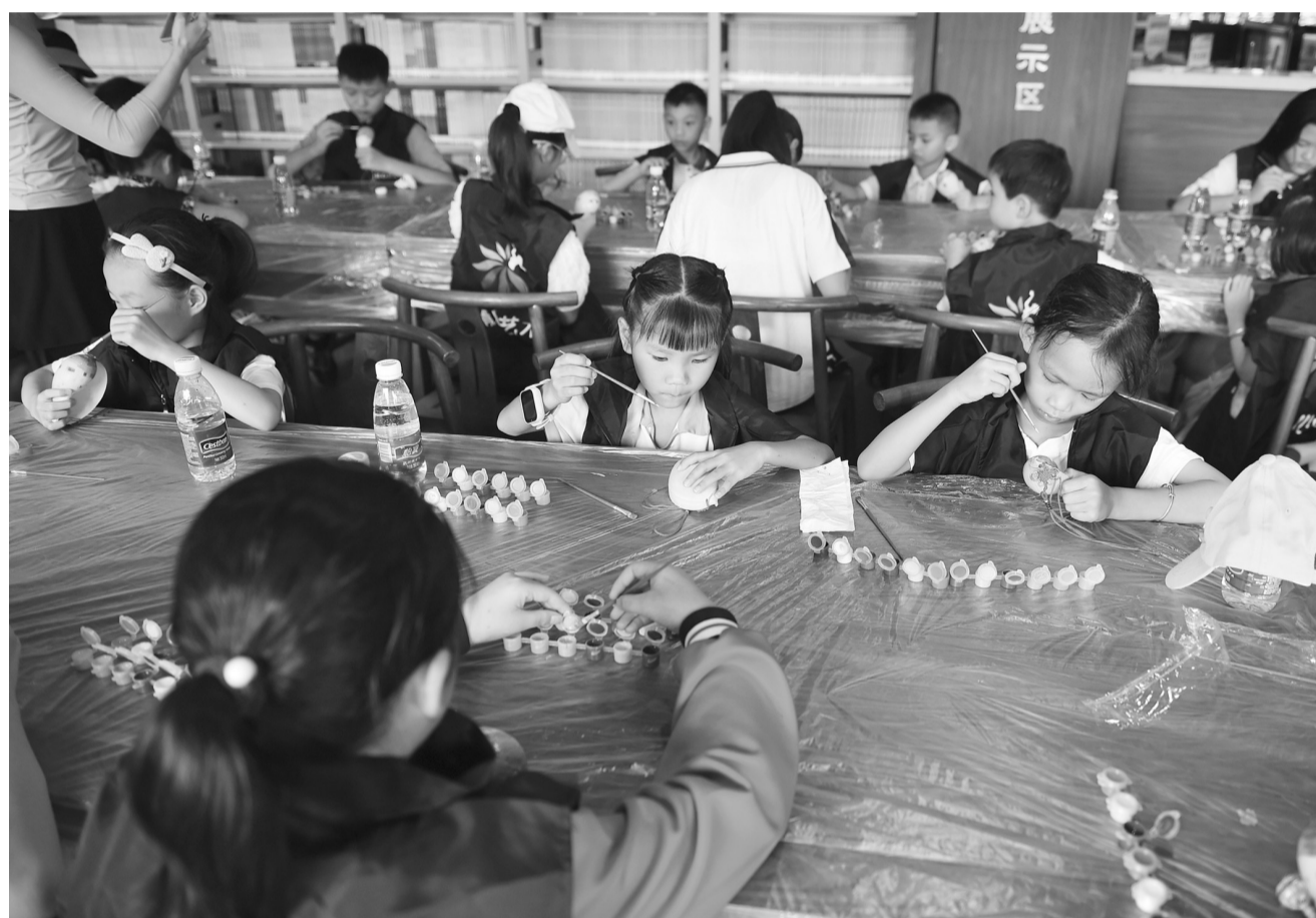
红树林文化创意绘画活动现场。