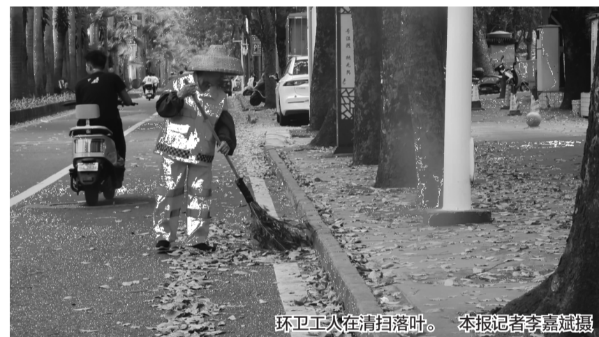
环卫工人在清扫落叶。