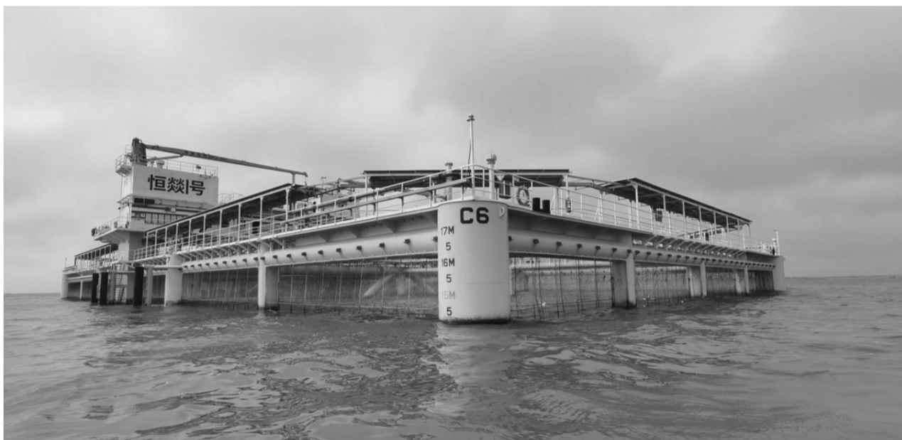
超强台风“摩羯”过后,“恒焱1号”养殖平台主体结构完好。

本报讯(记者李亚强 通讯员林国敏 王音默)超强台风“摩羯”过后,市公安局共出动警力1.5万人次、警车4000辆次,全力投身道路交通秩序维护、社会治安防控、紧急救援群众等工作。 公安交警部门加强对全市道路交通特别是徐闻、雷州等地主干道及港口、桥梁等重点路段、节点畅通情况的管理、监测,对受灾严重的道路进行交通疏导,确保救援物资和抢险救灾队伍优先通行。做好琼州海峡停航的交通应急处置,对滞留在进港公路、环岛公路、徐海大道等徐闻港路段的3900余辆货车和4200余名司乘人员进行转移、分流及安置,在恢复通航后引导其有序过海。 受台风影响,各地公安机关分别组织应急警力深入受灾区域,开展紧急救援。民警、辅警清除路障1900多处、修复护栏约37公里、修复道路标识200多处,消除路面隐患500多处。