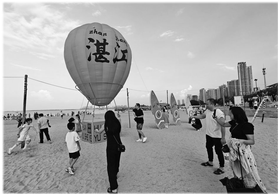
国庆假期,金沙湾景区游人如潮,市民享受阳光与海滩。

孩子们的欢笑声、海浪的轻涌声、风筝的呼啸声、荡气回肠的歌声交织在一起,便是我们一家人在金沙湾享受的欢乐假日时光。