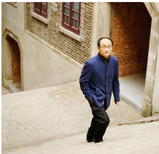
日常生活中的苏教授