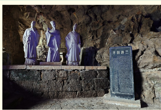
白行简、白居易、元稹雕像

壁上题诗万古芳。此景只应天上有，人间难得几回赏。”位于西陵山北峰峭壁上，有一巨大山洞，谓“三游洞”。它背靠长江三峡的西陵峡口，面临“清流涵白石，静见千峰影”的下牢溪，洞奇景异，山水秀丽。矗立的山体，布满先人的石刻传记，洞内呈不规则长方形，深约30米，宽约23米，高约9米，是古代地下水沿岩层岩面不断溶蚀，并经塌陷而形成的石灰岩溶洞。三游洞得名，距今已有近1200年的历史，颇具传奇色彩。