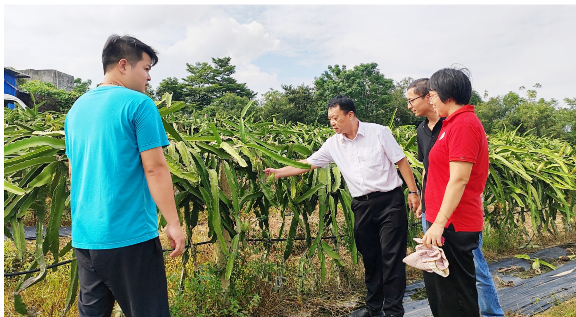
科技特派员（左二）送技术到田间。

本报讯 记者卓朝兴 通讯员张思燕 梁耐思报道：日前，广东省农村科技特派员团队成员到廉江市石颈镇开展驻镇帮扶与科技服务等工作。