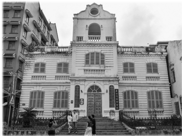
广州湾商会旧址,这里曾是赤坎最早的现代堂皇建筑。本报记者 郎树臣 摄

保护好历史遗址,才能留住历史;留住历史,是为了更好地面向未来。离开了三号码头遗址,笔者想得更多的是如何利用好赤坎古商埠的历史遗址,特别是更好地与“三民两大路”的老街区域有机联系互助互补。“广州湾商会”旧址作为赤坎古商埠的一个历史地标建筑,如果能成为“广州湾商会旧址陈列馆”,与赤坎古商埠的历史文化主题呼应,形成整体效应使赤坎古商埠焕发活力,那该多好。