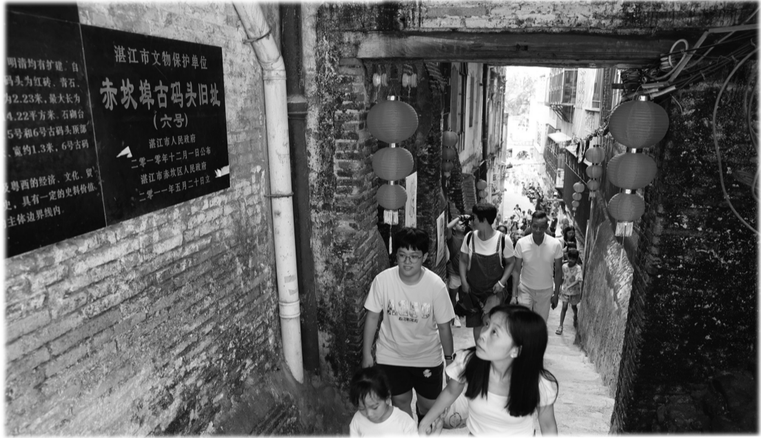
随着修缮日益完善,赤坎老街渐成网红打卡地。图为游客在老街6号码头游览。

昌公书局是雷州半岛人热爱读书,建设乡土文化的一个缩影;如今也已成为了访古寻幽,体会乡土生活的好去处。