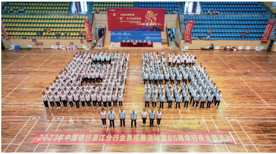
湛江中行全员拓展活动暨85周年行庆主题活动现场。

经济是肌体,金融是血脉。从扎根沃土到根深叶茂,湛江中行始终不忘坚守服务实体经济本源,把信贷资源倾斜投向关系国民经济的重大项目、重点领域、重点区域,为湛江“八大领域新跨越”、四大投资超