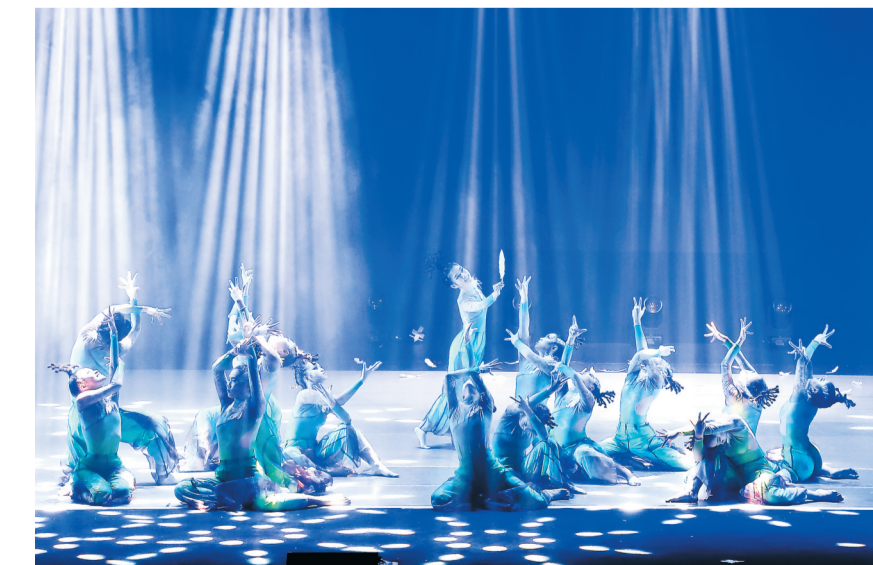
原创舞蹈作品《绿美密码》精彩展演。

《绿美密码》是该校的原创舞蹈作品。展演现场,随着一束光的照耀,“防风消浪、促淤保滩、固岸护堤”的守护故事拉开了序幕。25名演员以灵动的肢体、饱满的情感演绎出和谐共生、潮起潮落、绚丽多彩的红树林,生动展现了红树林的生态之美。向下扎根、向上生长,远望望去,树与树盘根错节,绕来缠去,形成一座座立