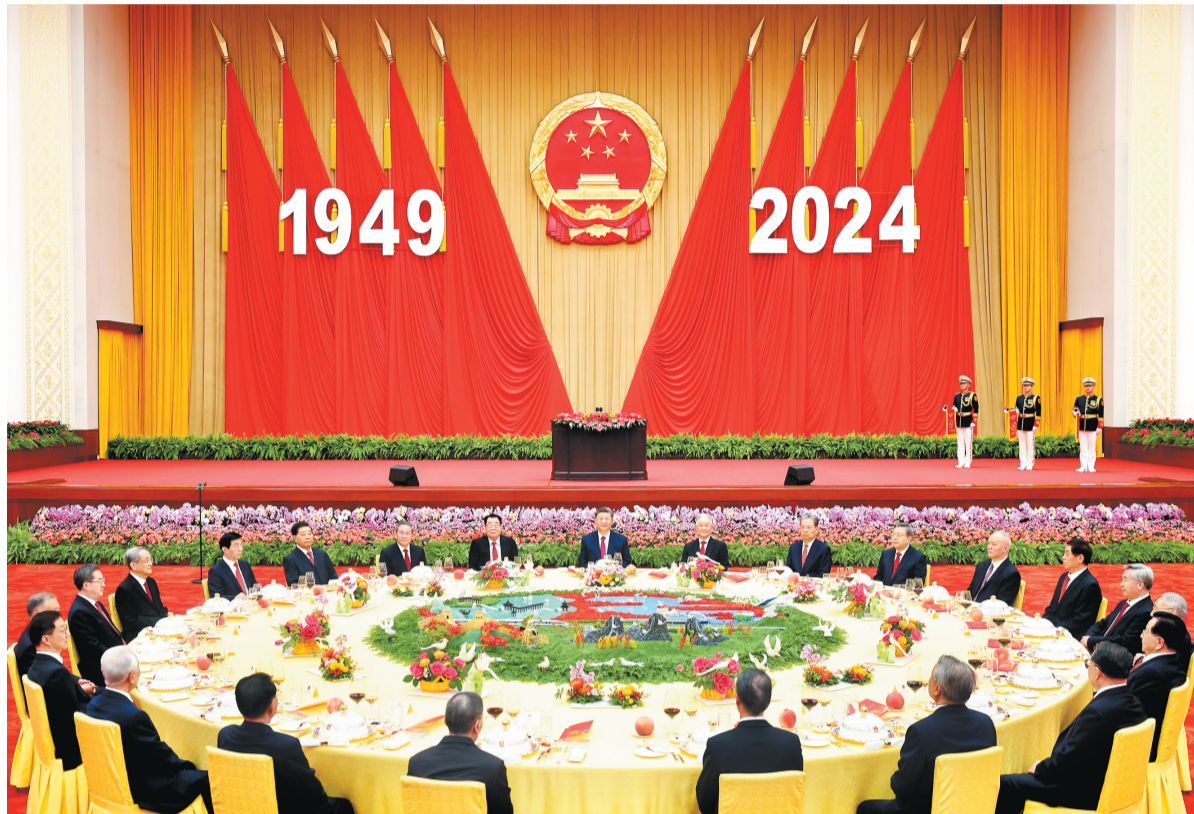
9月30日晚,庆祝中华人民共和国成立75周年招待会在北京人民大会堂隆重举行。习近平、李强、赵乐际、王沪宁、蔡奇、丁薛祥、李希、韩正等党和国家领导人与约3000名中外人士欢聚一堂,共庆新中国75周年华诞。

新华社北京9月30日电 庆祝中华人民共和国成立75周年招待会30日晚在人民大会堂隆重举行。中共中央总书记、国家主席、中央军委主席习近平出席招待会并发表重要讲话。他强调,中华人民共和国成立75年来,我们党团结带领全国各族人民不懈奋斗,创造了经济快速发展和社会长期稳定两大奇迹,中国发生沧海桑田的巨大变化,中华民族伟大复兴进入了不可逆转的历史进程。新时代新征程,中国人民必将创造出新的更大辉煌,必将为人类和平发展的崇高事业作出新的更大贡献。 李强主持招待会,赵乐际、王沪宁、蔡奇、丁薛祥、李希、韩正出席招待会。约3000名中外人士欢聚一堂,共庆新中国75周年华诞。