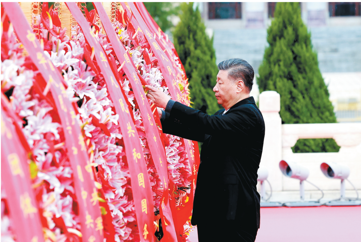
9月30日上午,党和国家领导人习近平、李强、赵乐际、王沪宁、蔡奇、丁薛祥、李希、韩正等来到北京天安门广场,出席烈士纪念日向人民英雄敬献花篮仪式。这是习近平整理花篮上的缎带。