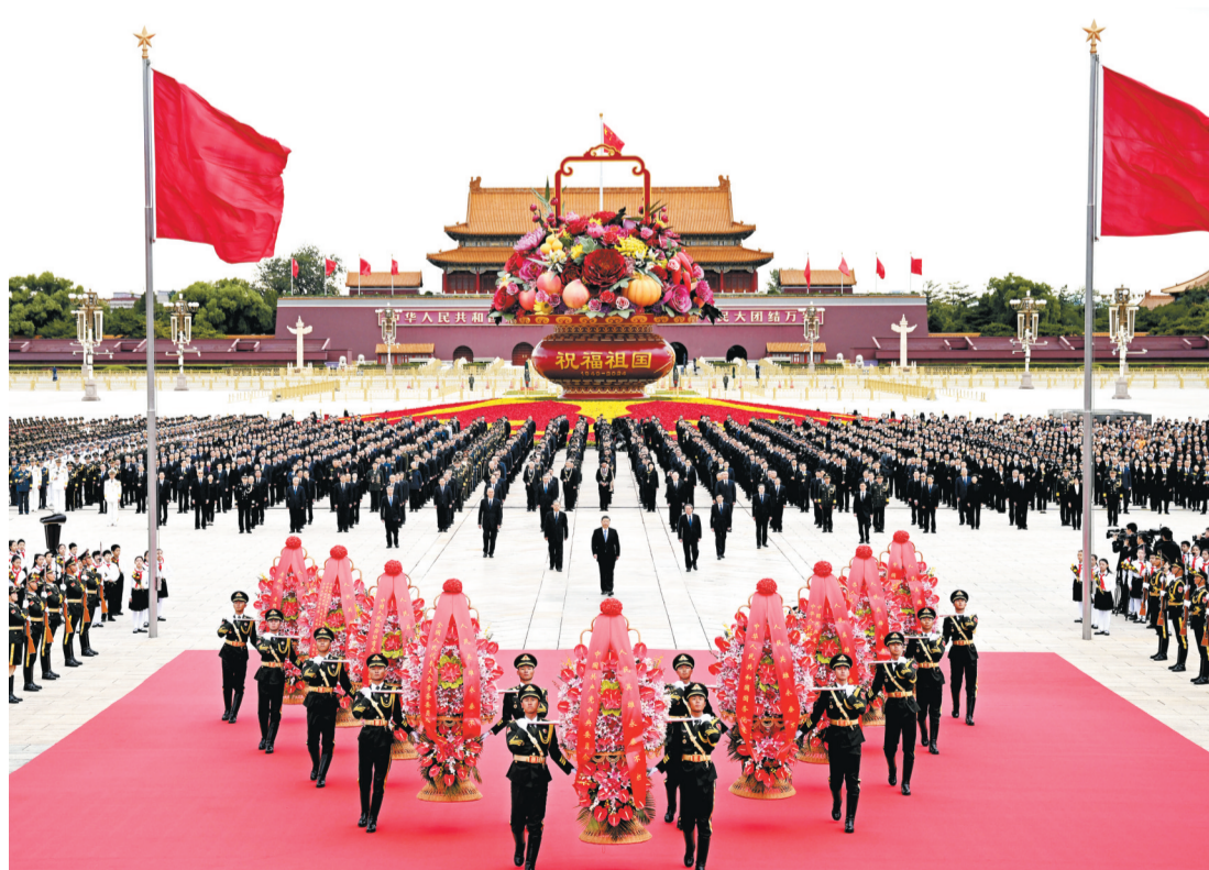
9月30日上午,党和国家领导人习近平、李强、赵乐际、王沪宁、蔡奇、丁薛祥、李希、韩正等来到北京天安门广场,出席烈士纪念日向人民英雄敬献花篮仪式。

新华社北京9月30日电 在庆祝中华人民共和国成立75周年之际,烈士纪念日向人民英雄敬献花篮仪式30日上午在北京天安门广场隆重举行。党和国家领导人习近平、李强、赵乐际、王沪宁、蔡奇、丁薛祥、李希、韩正等,同各界代表一起出席仪式。 壮阔的天安门广场上,鲜艳的五星红旗迎风招展。广场中央,“祝福祖国”巨型花篮表达着对祖国繁荣昌盛的美好祝福。巍然耸立的人民英雄纪念碑北侧,两组花坛上镶嵌着白菊等鲜花组成的18个花环,寄托着全体中华儿女对英烈的深切缅怀。