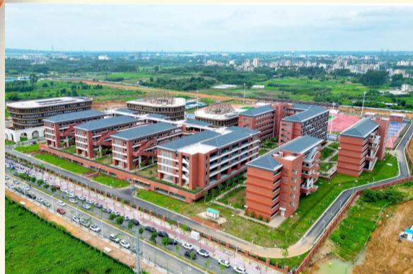
广东省实验中学湛江学校迎来首届学生。