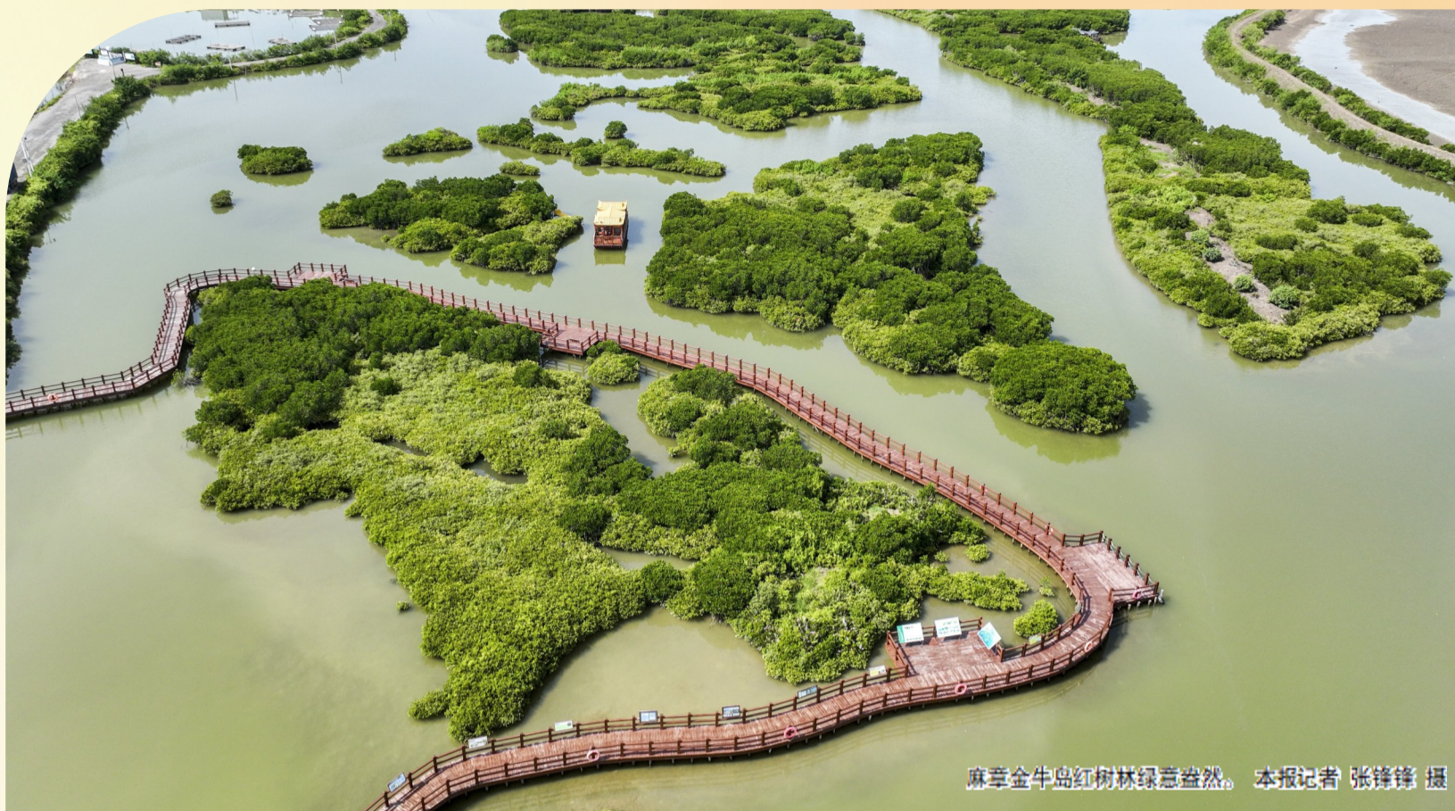
麻章金牛岛红树林绿意盎然。