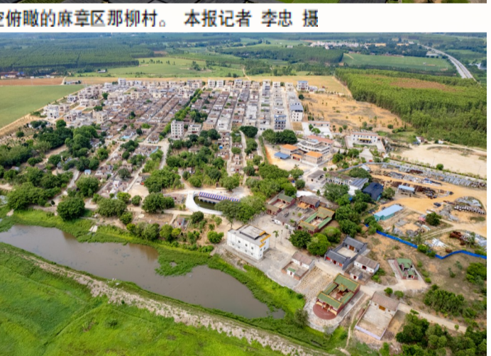
高空俯瞰的麻章区那柳村。

麻章区始终保持对各类违法犯罪活动的严打整治高压态势，全区刑事治安警情1287起，同比下降25.56%；刑事立案534宗，同比下降21.21%。扎实推进“雪亮工程”建设，重点区域视频监控覆盖率进一步提高，全区社会治安形势持续向好。麻章镇综治中心荣获2023年广东省“1+6+N”基层社会治理工作体系先进典型，麻章区被市信访工作联席会议办公室评为优秀等次。