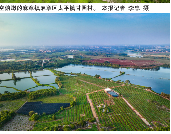
高空俯瞰的麻章镇麻章区太平镇甘园村。