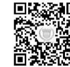
湛江市金融消费者权益保护联合会