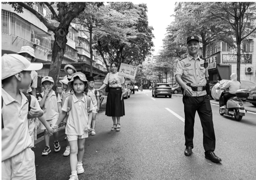
南桥派出所民警爱心护学。本报记者 张锋锋 摄

“警察叔叔,早上好!”迎着秋日的微风,伴随着一声声稚嫩的问候,警服与校服每天都在相遇。今年春季学期开学起,湛江公安牢固树立“校园安全无小事”理念,启动常态化校园“高峰勤务”护学模式,获得社会各界广泛赞誉。进入秋季学年,湛江公安加压奋进,持续强化“护学岗”工作模式,以实际行动践行对全市中小学、幼儿园学生安全的庄严承诺。