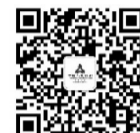
中国人民银行广东省分行

在实践操作环节,医护人员对急救救护的具体操作程序及要点进行详细讲解,指导学员在仿真模拟人和专业设备的辅助下,分组进行了心肺复苏、海姆立克急救法、止血包扎等关键急救技能的实操操作,对急救技能各个环节进行分析指导,鼓励学员踊跃参与,大家热情高涨,用心听、认真记、努力学,展示了良好的学习态度和求知精神,现场气氛十分活跃。学员纷纷表示,这次急救公益讲座非常有益,对大家的工作和生活都有很大帮助,因为意外随时会发生,掌握这些技能,让大家在面对突发事件时能够更加有信心和从容应对,对自己、同事、家人和朋友都多了一份保障。