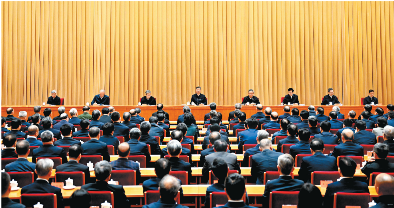
4月8日至9日,中央周边工作会议在北京举行。中共中央总书记、国家主席、中央军委主席习近平出席会议并发表重要讲话。 李强、赵乐际、王沪宁、蔡奇、丁薛祥、李希、韩正出席会议。

新华社北京4月9日电 中央周边工作会议4月8日至9日在北京举行。中共中央总书记、国家主席、中央军委主席习近平出席会议并发表重要讲话。中共中央政治局常委李强、赵乐际、王沪宁、蔡奇、丁薛祥、李希,国家副主席韩正出席会议。 习近平在重要讲话中系统总结新时代以来我国周边工作的成就和经验,科学分析形势,明确了今后一个时期周边工作的目标任务和思路举措,强调要聚焦构建周边命运共同体,努力开创周边工作新局面。