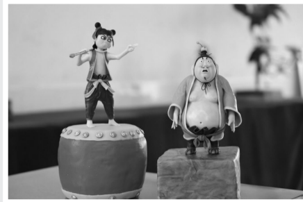
何华勇面塑作品。(资料图片)