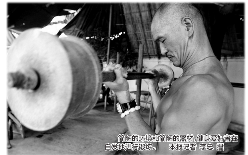
简陋的环境和简陋的器材，健身爱好者在自发地进行锻炼。 本报记者 李忠 摄

在关节的活动度、稳定度，以及大脑对神经的控制等这些身体基础素质方面，人与人之间可能存在巨大差距。一些医生也表示，对于那些本身就患有高血压、心脏病、腰椎间盘突出等疾病的患者，在训练中切忌盲目跟练、急于求成。 新华社