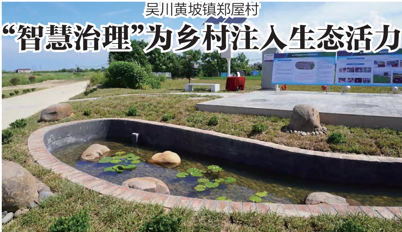
郑屋村的智能生态处理池。