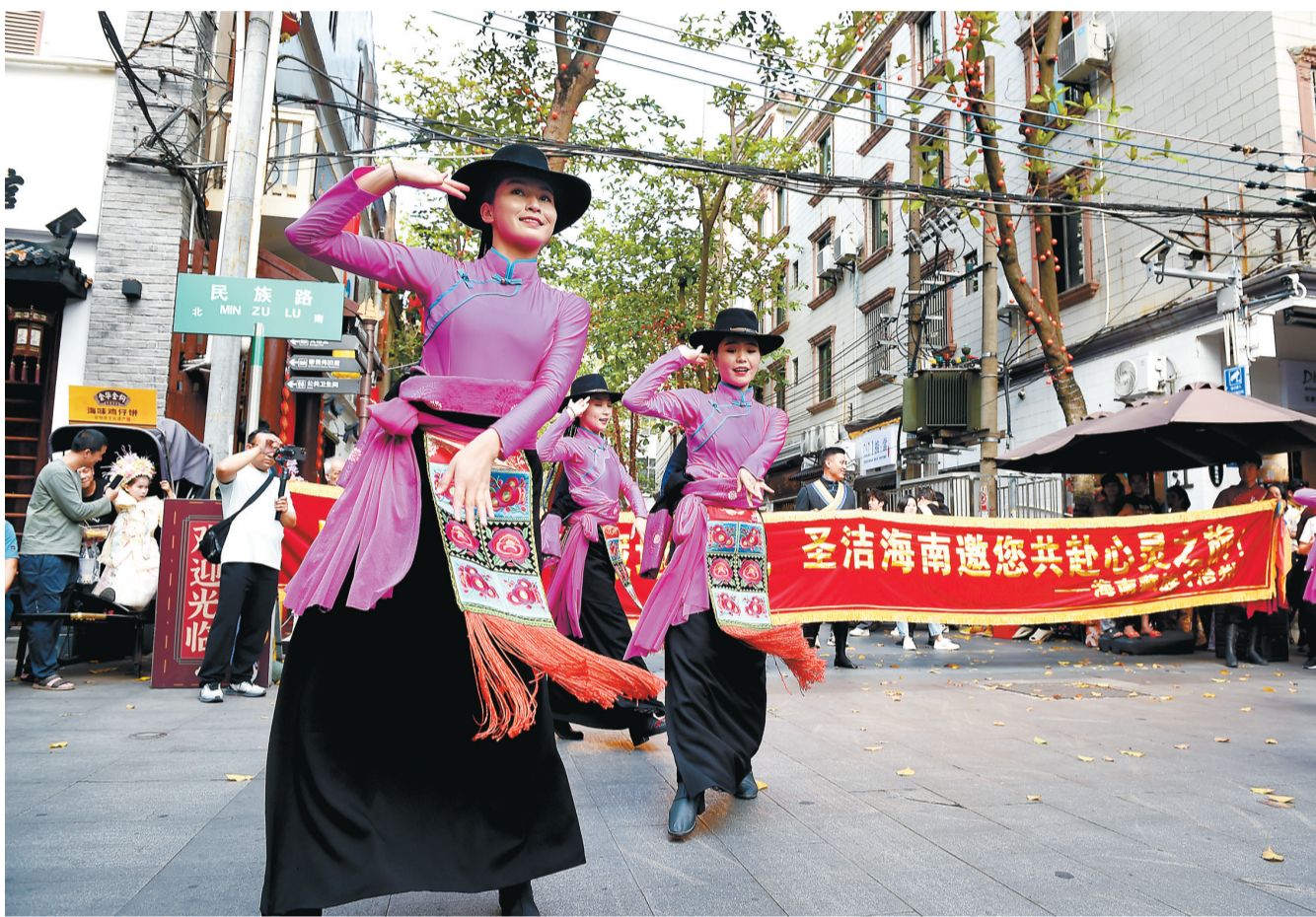
来自青海的舞蹈在赤坎老街路演。

本报讯(记者卓朝兴)4月9日,青海省海南藏族自治州文体旅游广电局来湛江开展“山宗水源·大美青海·圣洁海南”主题文旅资源推介活动,受到港城广大市民欢迎和好评。