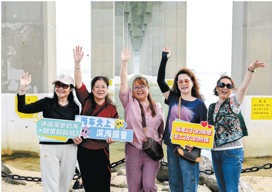
4月14日,自驾车的车主和游客在湛江观光打卡。

据悉,广东地处南海之滨,有着全国最长的海岸线,滨海旅游资源丰富,潜力巨大。本次自驾游活动是“文旅促发展 助力百千万”2025年广东滨海(海岛)旅游联盟系列活动之一,是助力广东打造滨海旅游新高地、加快建设旅游强省、推动“百千万工程”走深走实的生动实践,对推动广东省滨海旅游加快发展、带动自驾游市场消费升级、推进旅游业高质量发展具有重要意义。