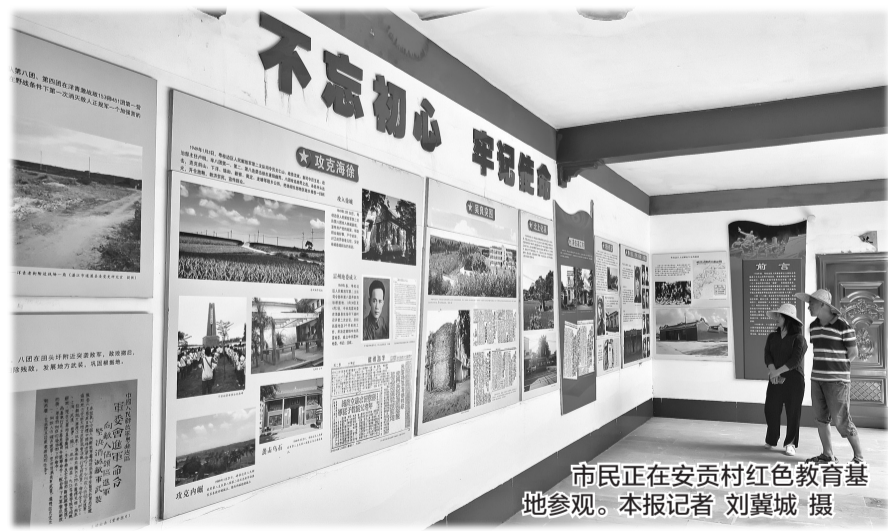
市民正在安贡村红色教育基地参观。

“我们正转换土地经营方式，将部分红薯地改为种植百香果，凭借高商品率、色泽靓、甜度高的果品打造特色品牌。”陈焕国告诉记者，接下来，安贡村除了发展果园，还发展农村电商、完善帮扶农家乐项目基础设施，建老年人活动室、超市、饭堂等，不断壮大集体经济，增加村民收入，助力乡村振兴。