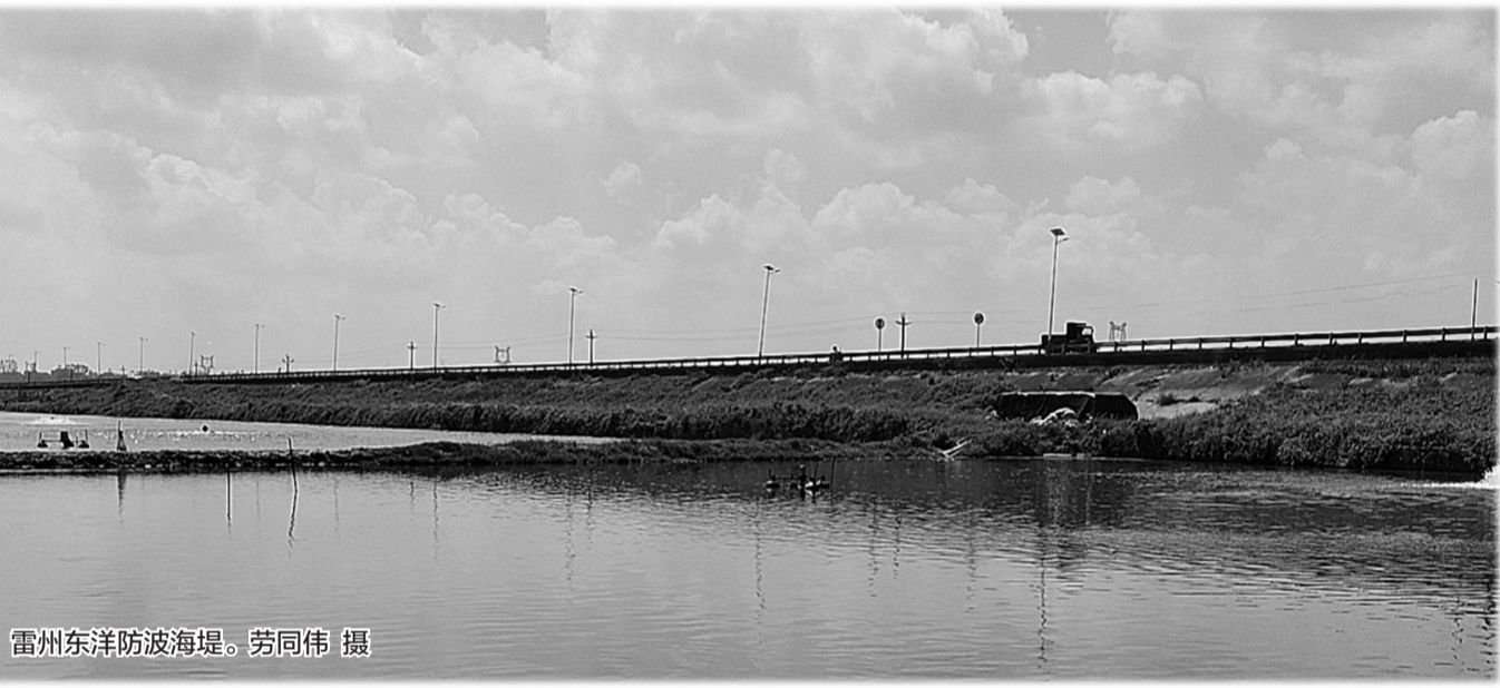
雷州东洋防波海堤。