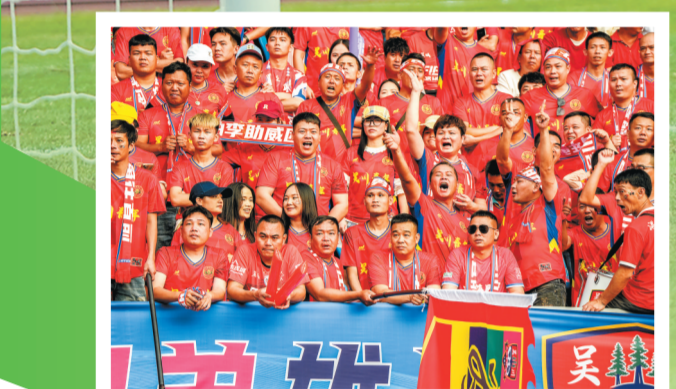
激情呐喊。