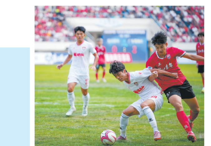
背身护球。本报记者李嘉斌 通讯员谭朝冠 摄