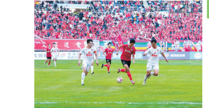
带球突破。