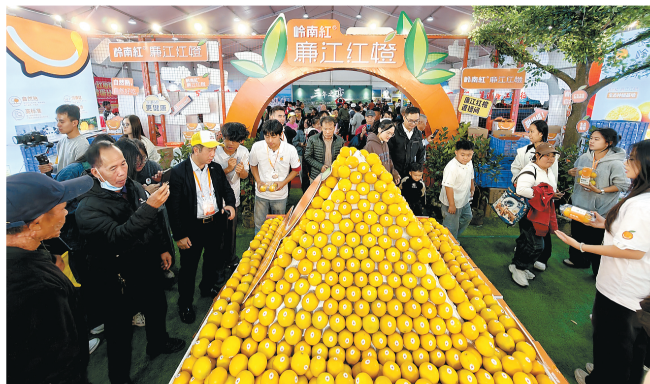
2025廉江红橙产业大会红橙展馆人气旺。

除了主角红橙,展馆内的特色农产品也备受青睐。兴旺农业公司带来的湛江鸡、火山冬薯、芭乐等产品围满了试吃