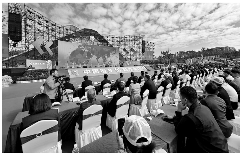
2025廉江红橙产业大会现场。