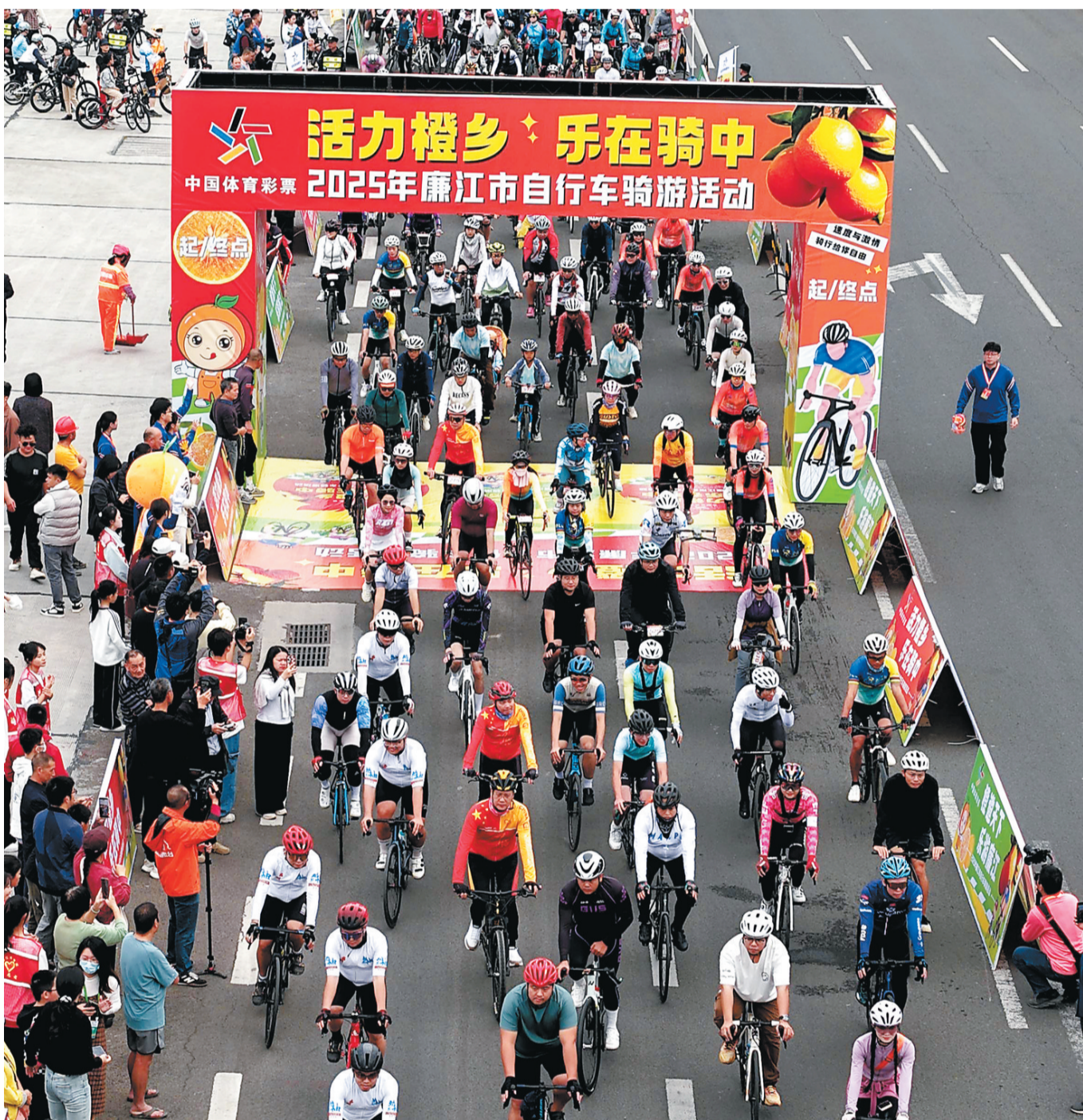
11月30日,“活力橙乡 乐在骑中”2025年廉江市自行车骑游活动在廉江市体育中心启程。