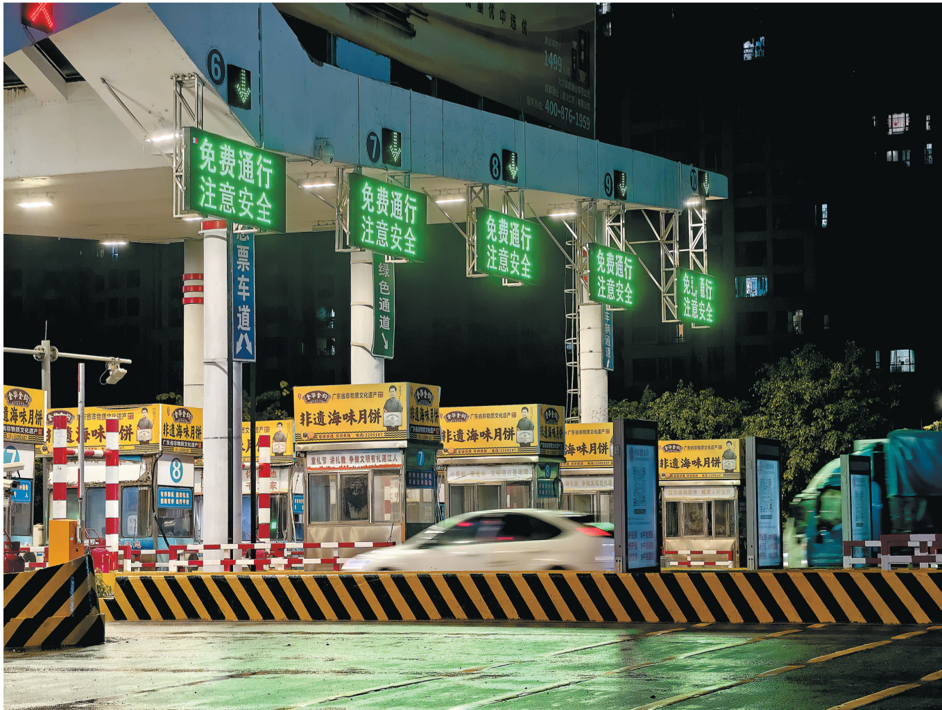
7月1日零时起,湛江海湾大桥免费通行。