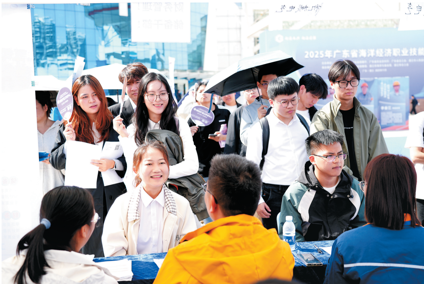
11月28日,2025湛江市“才聚港城”秋季招聘会在湛江国际会展中心举行。