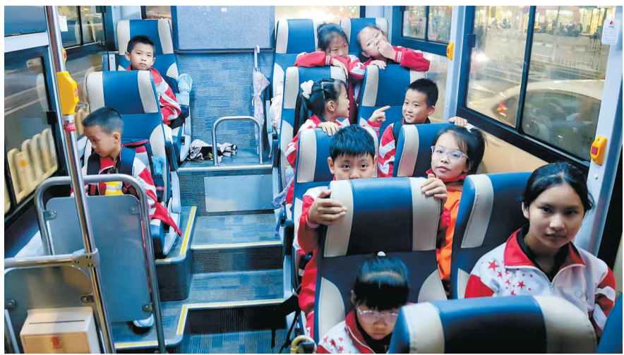
10月23日,学生们乘坐湛江市二中海东小学学生专线公交车。