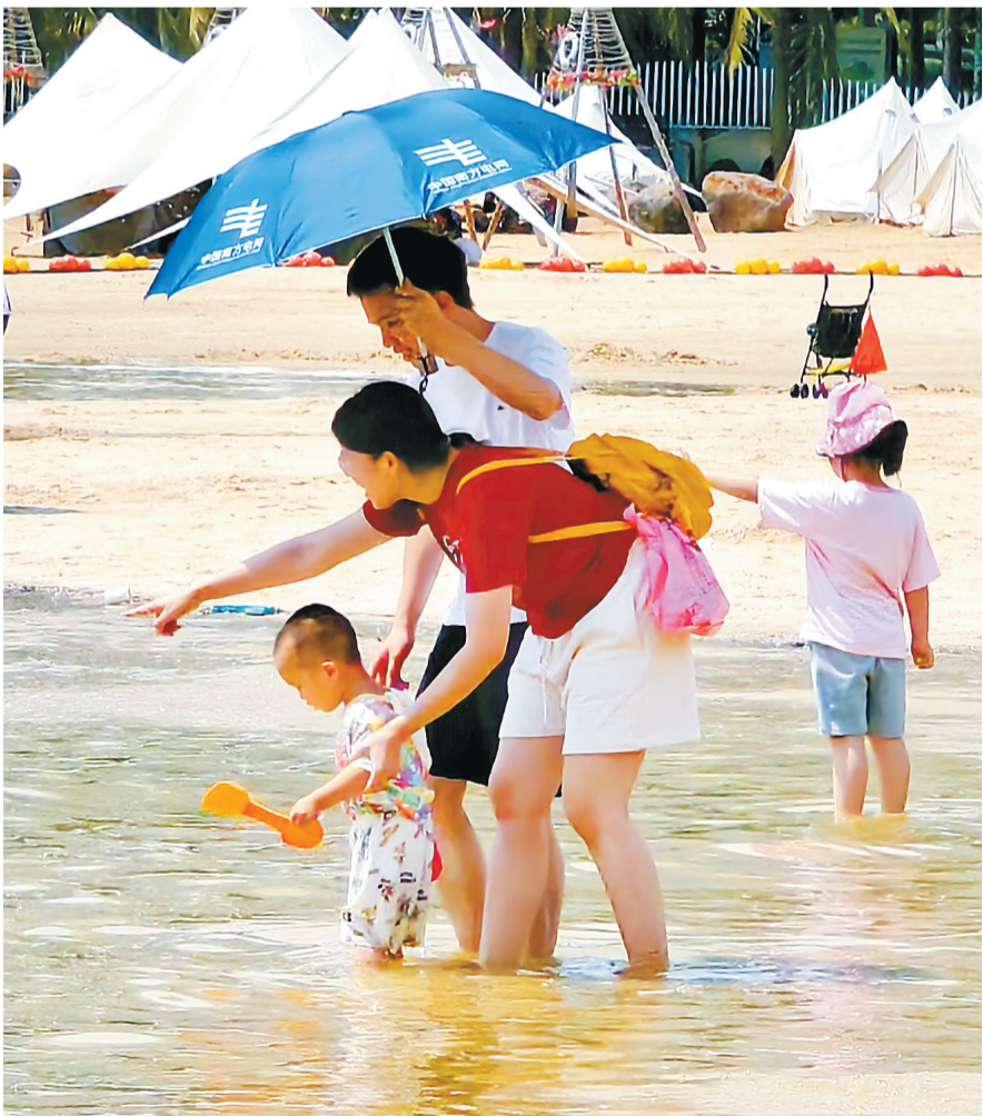
7月13日,家长带着小朋友在赤坎区金沙湾海滨浴场玩水。

翻阅2025年的港城记忆,一张张图片背后,是湛江海湾大桥的畅通无阻、是定制公交的准时守候、是校园餐的温热飘香……这些年度关键词串联起的民生幸福账,藏着真切的民生温度。当2025年走向尾声,这份满载获得感的记忆,将成为港城继续前行的底气,让幸福在新的一年里续写新的篇章。