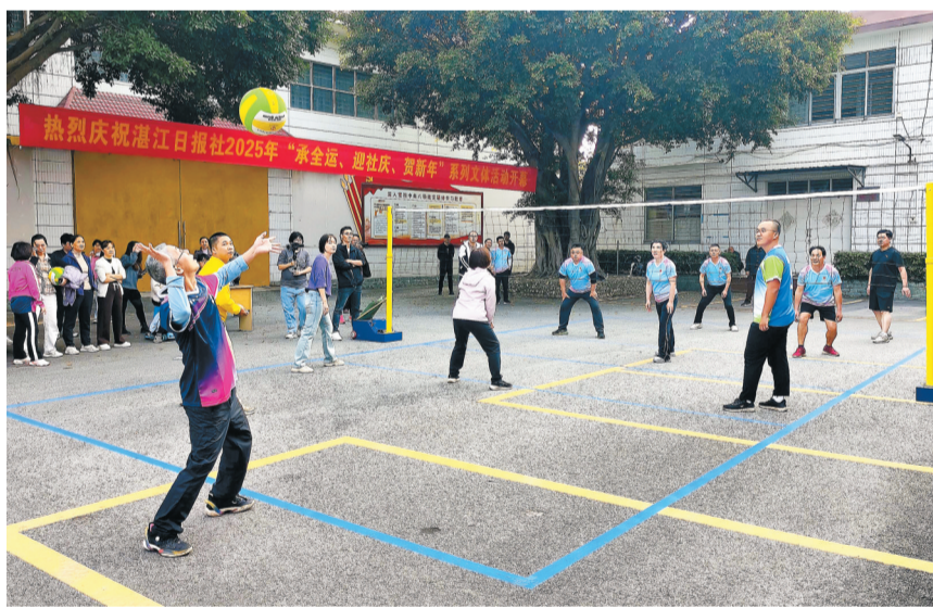
12月16日,湛江日报社2025年“承全运、迎社庆、贺新年”系列文体活动启动,图为气排球比赛现场。

本报讯 (记者范子华) 12月16日,湛江日报社启动“承全运、迎社庆、贺新年”系列文体活动,通过多元文体形式凝聚团队力量,打造“有温度、有活力、有担当”的新型主流媒体团队。 据悉,本次系列活动由报社工会牵头组织,形式多样、内容丰富,涵盖五人制足球赛、羽毛球团体赛、气排球赛、乒乓球个人赛及直播才艺表演五大类别,将分阶段有序开展。其中,足球、羽毛球、气排球赛分别以行政队、采编队、经营队、发行印务队为单位展开角逐;直播才艺表演则依托报社旗下音乐直播平台“朝阳 MusicLive”,为员工搭建展示歌唱、诗歌朗诵等才艺的舞台。 开幕式现场,一场别开生面的气排球揭幕战瞬间点燃全场热情。社领导对对阵职工联队,双方队员在报社大院临时搭建的场地上展开激烈角逐。发球、接传、扣杀……精彩的比赛引得场下喝彩声此起彼伏。