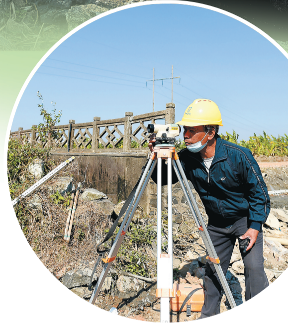
▲雷州东西洋清淤现场，施工人员在现场勘察。

雷州市有关部门在作业配合、群众工作等方面给予了全力支持，保障现场用水用电需求，协调专业医护人员全程守护，军民携手谱写了乡村振兴新篇章。