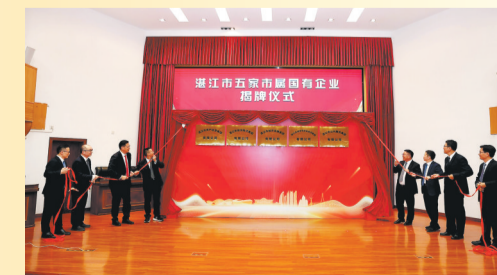
11月7日,湛江市五家市属国有企业正式揭牌成立。

11月7日,湛江市五家市属国有企业成立大会召开,湛江市城市发展集团有限公司、湛江市海洋与农业投资集团有限公司、湛江市旅游投资集团有限公司、湛江市公共服务集团有限公司、湛江市资产运营集团有限公司等五家市属国有企业正式揭牌成立。这是我市国资国企改革的重要里程碑,标志着我市在优化国有资本布局、提升国企核心竞争力方面取得了突破性进展。全市国资国企改革迈入资源整合更高效、产业协同更紧密、发展动能更充沛的新阶段。