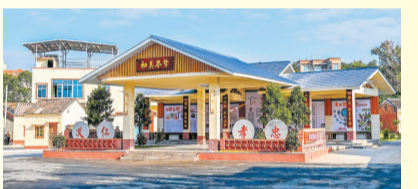
霞山区岑肇村和美岑肇理事长廊。

2025年是推动“百县千镇万村高质量发展工程”三年初见成效之年。湛江以“百千万工程”为抓手,立足各县(市、区)资源禀赋,以特色产业为支点,以融合发展为路径,在海洋经济提质、制造业升级、文旅融合破圈、数字农业赋能四大领域精准施策,一批县域经济增长加速崛起;各镇街在民生设施提质、闲置资源盘活、文旅融合赋能三大领域精准发力,一批镇域发展典型加速涌现;通过系统推进典型村建设,持续提升和美乡村的“颜值”与“内涵”,村庄面貌日新月异。