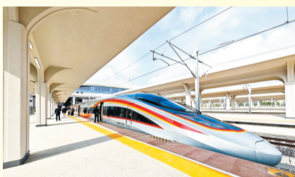
12月22日,广湛高铁通车。本报记者张锋锋 摄

作为国家“八纵八横”沿海通道关键段,广湛高铁不仅让湛江全面融入大湾区“90分钟生活圈”,更推动其从交通末梢跃升为联动大湾区、北部湾城市群与海南自贸港的枢纽城市。不仅释放既有线路货运能力,助力湛江临港产业升级与文旅资源开发,更加速大湾区资本、人