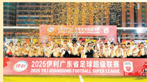
吴川青年队喜夺省超桂冠。

冠军荣耀,因拼搏而愈发厚重。吴川青年用5个月的热血征程证明,比起奖杯本身,那些在逆境中坚守的信念、在拼搏中凝聚的力量、在热爱中联结的情感,弥足珍贵。这场终场绝杀夺冠,更是将这份信念、力量与情感推向了巅峰。它不仅是一支球队的胜利,更是一座城市的荣光;不