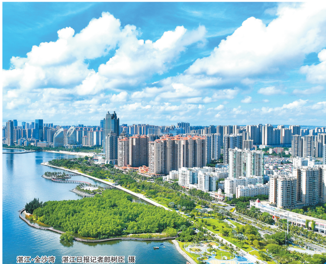
湛江·金沙湾