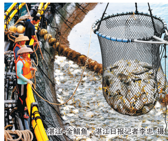
湛江·金鲳鱼