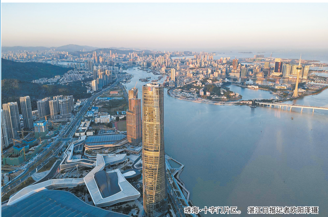
珠海·十字门片区。