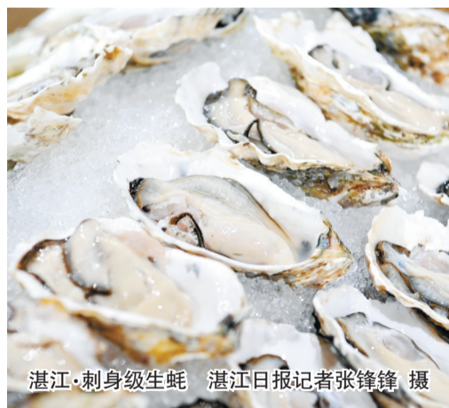
湛江·刺身级生蚝