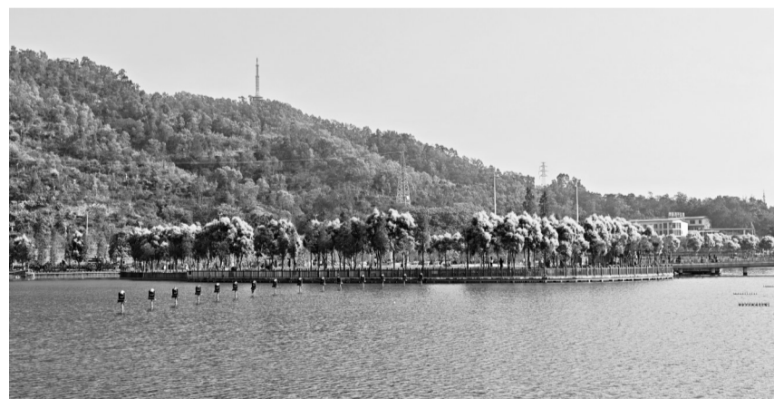
塘山岭公园一景。

“上野的樱花烂漫的时节,望去却也像绯红的轻云……”还没见到樱花,我已像鲁迅先生的笔下想象它的绰约风姿