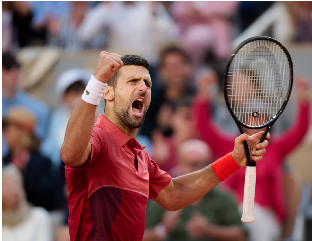
6月3日,焦科维奇在比赛中庆祝得分。