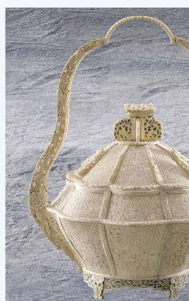
清象牙通雕人物故事菱花提篮