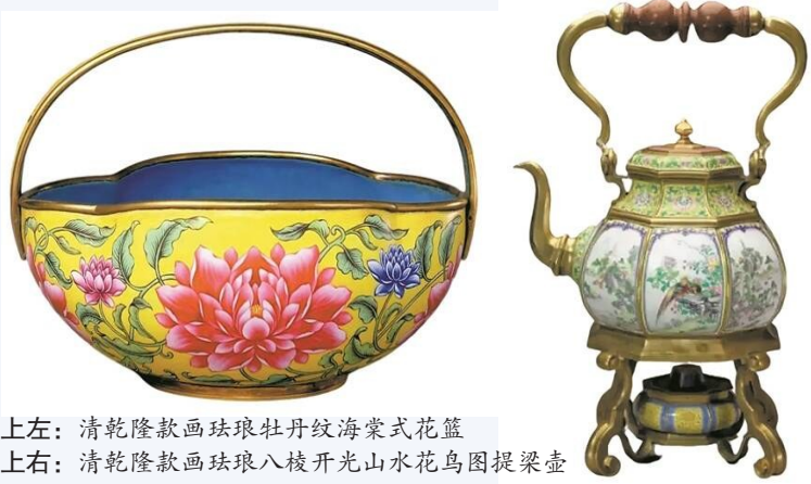
左上:清乾隆款画珐琅牡丹纹海棠式花篮 右上:清乾隆款画珐琅八棱开光山水花鸟图提梁壶