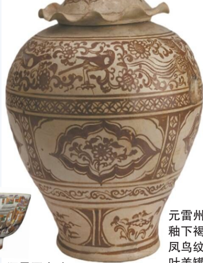
元雷州窑釉下褐彩凤鸟纹荷叶盖罐