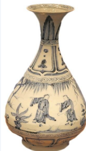
元青花人物图玉壶春瓶