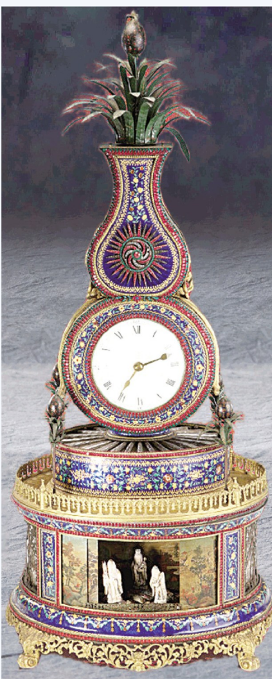
清铜胎鎏金透明珐琅人物转花座钟 广东省博物馆藏

金锭2002年出土于湖北省钟祥明代梁庄王墓,正面铸有“永乐十七年四月 日西洋等处买到 / 八成色金壹锭伍拾两重”铭文。永乐十七年是1419年,正是郑和第五次下西洋归来之时,从铭文可知,这件金锭是郑和船队于返回途中用在西洋所买的一批黄金制作的。“西洋”是当时泛指明朝南海以西的海洋,包括印度洋及其沿海地区。